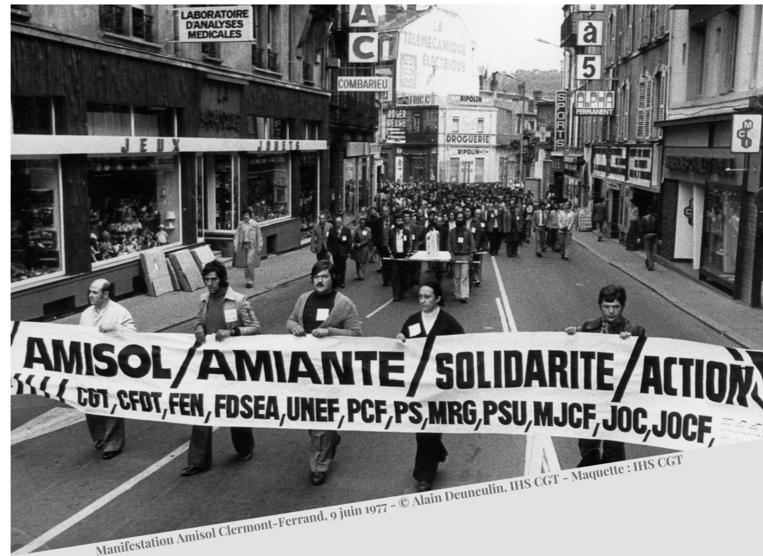
Manifestation Amisol Clermont-Ferrand, 9 juin 1977 - Maquette : IHS CGT

Métro, ligne 12 : station Front populaire